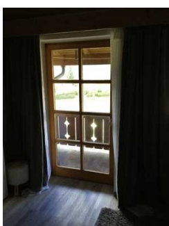
Tür zum Balkon