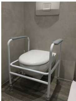
Aufstehhilfe für Toilette - höhenverstellbar