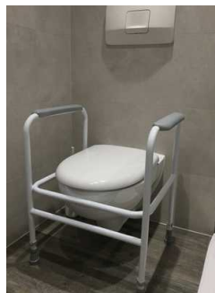
Toilette mit Aufstehhilfe