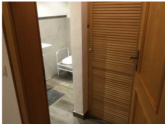
Tür zum Badezimmer