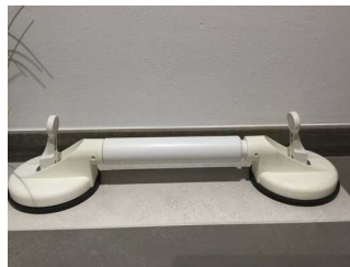
variabler Haltegriff mit Saugnäpfen