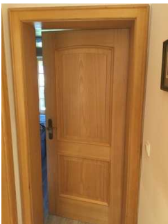
Tür zum Schlafzimmer