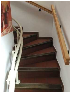
Treppe zur Wohnung