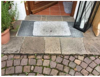
Stufe zur Haustür