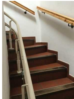
Treppe zur Wohnung