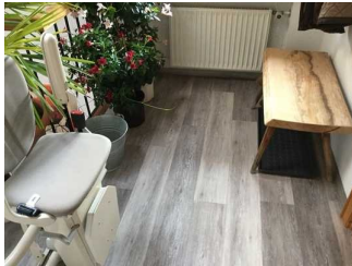
Weg zwischen Treppe sowie Treppensitzlift und Wohnungstür