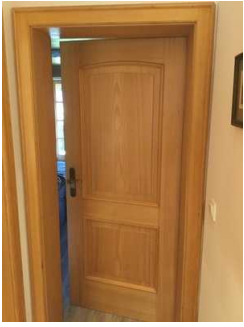
Tür zum Schlafzimmer