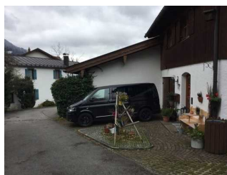
Weg zwischen Parkplatz und Eingang