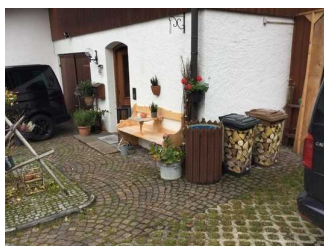
Weg zwischen Parkplatz und Eingang