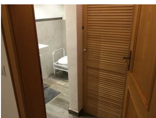
Tür zum Badezimmer