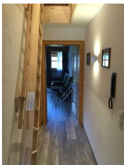
Flur zwischen Küche und Schlafzimmer sowie Badezimmer